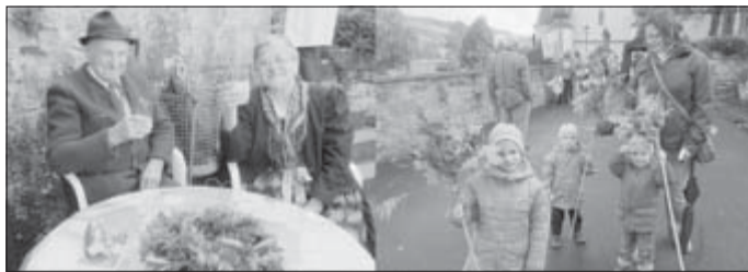
Jung und alt beim Erntedankfest

Zum Erntedankfest kamen Teilnehmer aller Generationen in die Wallfahrtskirche zum Dankgottesdienst. Die Kinder hatten mit dem Obst- und Gartenbauverein prächtige Palmstecken gebastelt, die sie bei der Ernteprozession - begleitet von den Oldies des Spielmannszuges - mitbrugen.